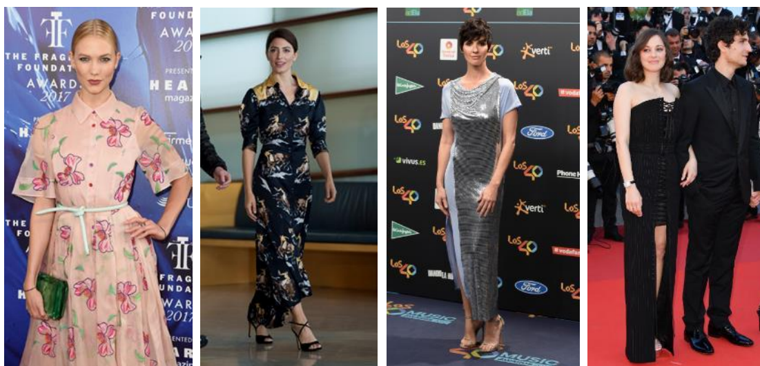
De gauche à droite : Karlie Kloss, en Carolina Herrera ; Barbara Lennie, en Nina Ricci ; Paz Vega, en Paco Rabanne ; et Marion Cotillard en Jean Paul Gaultier.

Jean Paul Gaultier se concentre toujours sur la haute couture avec des collections qui subjuguent l'univers de la mode.