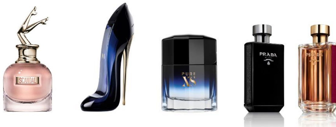
Scandal (Jean Paul Gaultier), Good Girl (Carolina Herrera), Pure XS (Paco Rabanne), et L'Homme et La Femme Intense (Prada).

Pure XS – le nouveau masculin de Paco Rabanne – et l'essor de Prada sur ses principaux marchés cibles ont alimenté l'excellente croissance des ventes de fragrances.